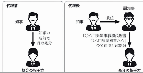
図表2-2 権限の代理の効果

代理は、本来の行政庁が授権行為を行うことによって代理関係が生ずるものです。対外的には権限は移動しておらず、本来の行政庁に属したままです。代理機関が、本来の行政庁の代理者であることを明示（顕名）して行為を行うことによって、その行為の効力は本来の行政庁に帰属することになります。