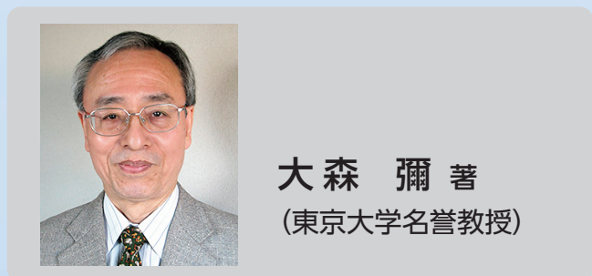
大森 彌 著 (東京大学名誉教授)