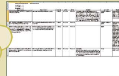
概要ダウンロード

検索した改正情報をExcelにダウンロード。社内の情報共有、ISO審査での活用ができます。