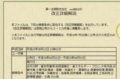
詳細ダウンロード